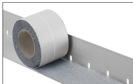
Obr. 2: Celoplošné nalepení Schlüter®-BARA-HV