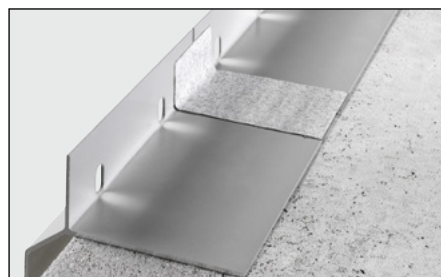
Obr. 1: Izolace spojů na sraz se Schlüter®-BARA-HV

Profily nevyžadují žádné zvláštní udržování nebo údržbu. Povrchová úprava hliníkového profilu je stálobarevná. Poškozená místa na pohledové ploše lze odstranit přelakováním.